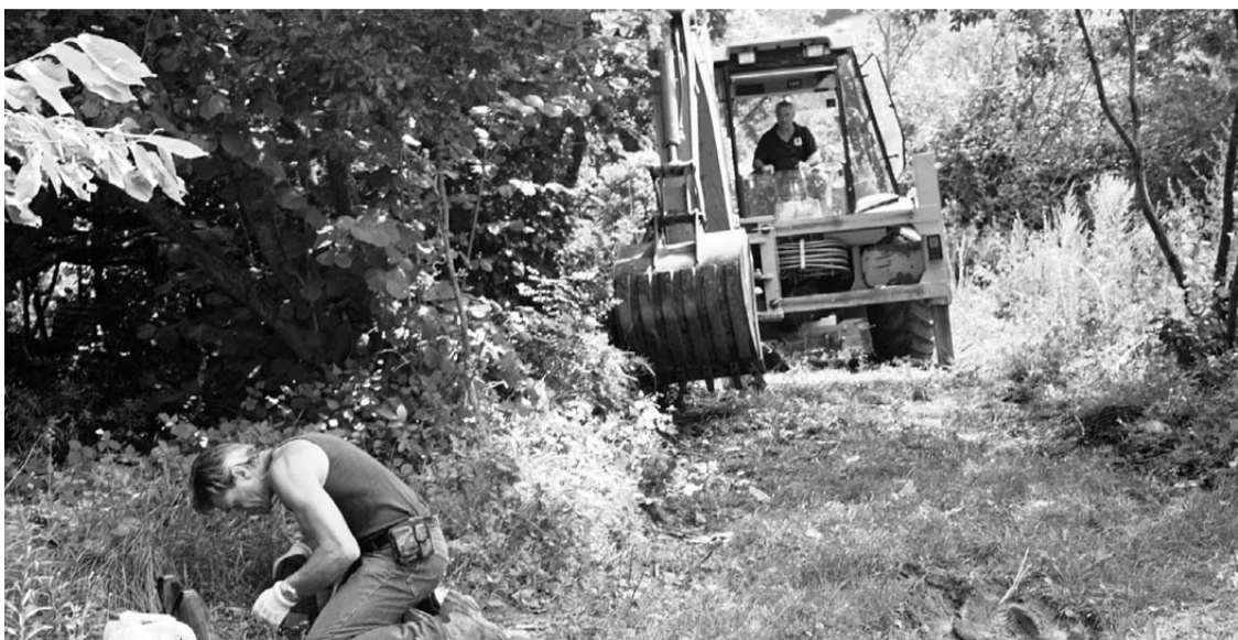
Sentiero Toazzo - Perotti

Con iniziative come questa, il Nure può tornare ad essere risorsa turistica.