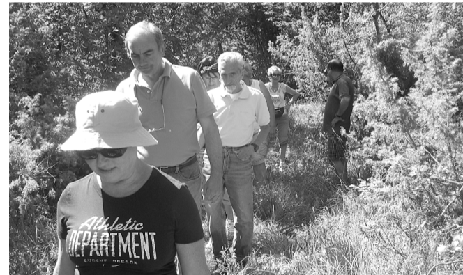
Le immagini di Ferriere mostrano la piscina e il percorso dell'antica mulattiera